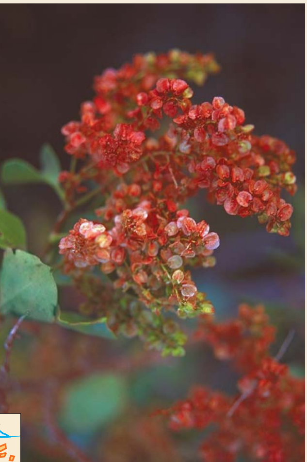
VINAGRERA (Kanarenampfer - Rumex lunaria )

! Auf der gesamten Route besteht: Deckung für das Handy, obwohl wir auf dem Grund der Schlucht manchmal Schwierigkeiten haben könnten, Anschluß zu bekommen. Bevor wir uns auf diesen Weg machen, ist es wichtig, die Rückkehr zu planen, oder jemandem Bescheid zu sagen, daß er uns am Ziel abholt, denn in Cercados de Araña gibt es keine öffentlichen Verkehrsmittel. Es besteht immer die Möglichkeit, auf eine andere Route überzuwechseln oder zu versuchen, von einem anderen Punkt aus, von dem die Verkehrsverbindungen besser sind, zurückzukehren.