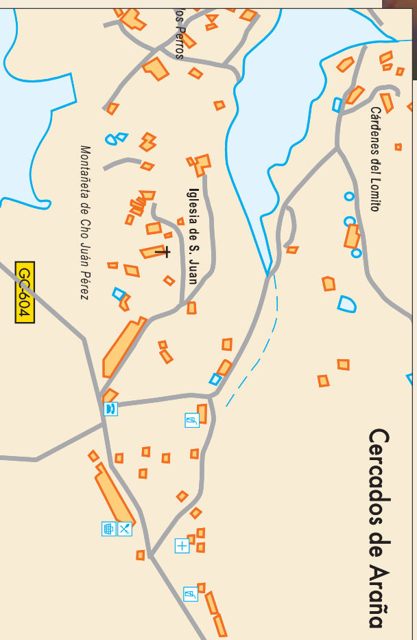
Cercados de Araña

Sehr verästelt mit runden Stengeln, die ältesten davon braun, die jungen grün und saftig, knochtig, die Ocra hüllt die Basis des Blattstils ein. Eine weit verbreitete Pflanze, die man auf sämtlichen Inseln findet. Sie bewohnt offene Lebensräume, wie zum Beispiel Straßentränken, besonders in den niedrigeren Zonen. Schnellwachsend hat sie auch den Vorteil, als Heckpflanze benutzt werden zu können. An einigen Orten wird sie häufig als Medizinalpflanze eingesetzt, vor allem gegen Entzündungen und Bluthochdruck. Sie ist auf den Kanarischen Inseln endemisch, hat sich aber auch auf einigen anderen Mittelmeerinseln wie z.B. Sizilien klimatisiert.