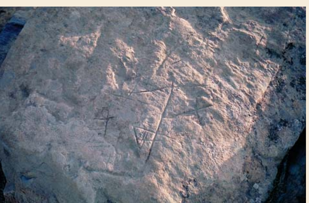
Grabado cercano a la presa.