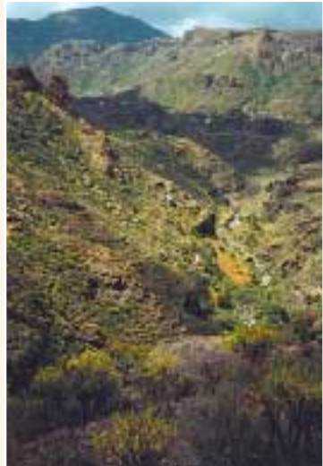
Los Portillos - Barranco de Soria