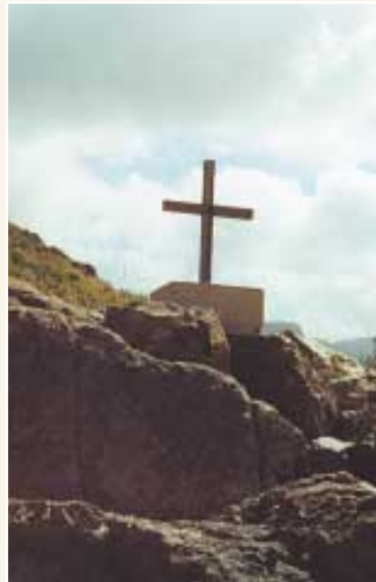
Cruz de Los Caminos

La Cruz de los Caminos lleva su nombre debido a que, desde este punto, podemos dirigirnos en cuatro direcciones. El camino que aquí se describe se dirige hasta el mismísimo muro de la presa de Soria, el embalse de agua con mayor capacidad de la Isla. El sendero desciende casi todo el tiempo entre una variada vegetación, aunque principalmente tajinastes ( echium onosmufolium ) y retamas ( teline microphylla ), que a veces nos impedirá ver con claridad el camino empedrado, digno de ser recuperado y conservado.