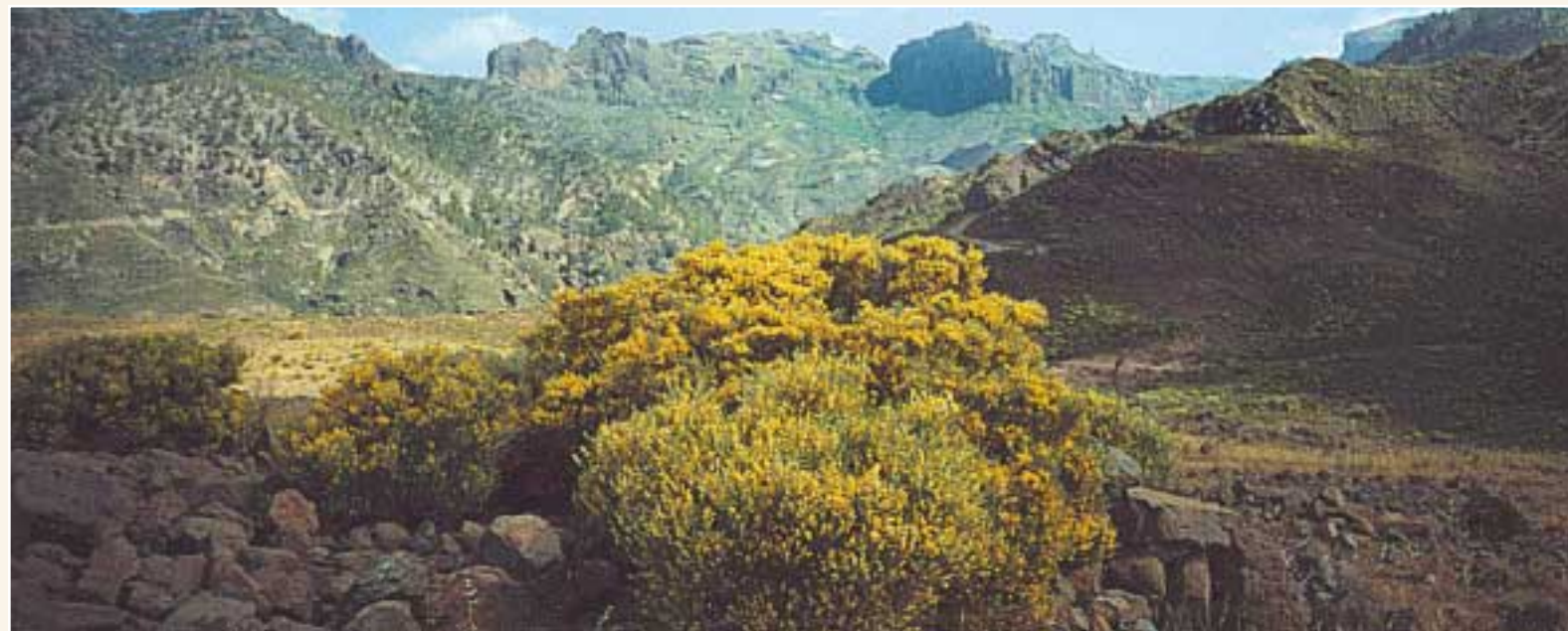
Llano del Corral - Morro del Cabrero

adornan el camino, destacando el Caído de Soria, espectacular cuando rebose el agua de la Presa de Las Niñas. Si hacemos este recorrido próximo a los meses de verano y durante él, podemos beneficiarnos de numerosos frutales abandonados.