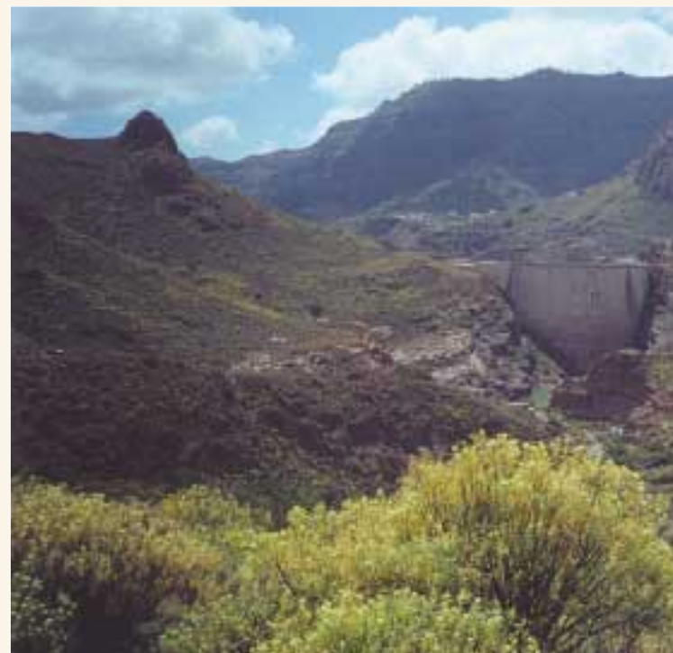
Presas de Soria

de naranjeros. A continuación, nos cruzamos con el camino que viene de la finca de Los Portugueses, tomando hacia la izquierda para ver poco después las casas de Los Portillos, y dirigimos por el camino que se conoce por los lugareños como las Vueltas del Candado. Seguidamente, cruzamos la Cañada de la Umbría para pasar, después de un suave ascenso, una puerta que se usaba para impedir el paso al ganado. Descendemos por el camino empedrado pasando al lado de una finca vallada con tela metálica, para desviarnos pocos metros después a la izquierda en una curva pronunciada a la derecha que lleva a las casas y que debemos evitar. Dejamos atrás la última casa y subimos a la izquierda hasta pasar por encima de un aerogenerador. Continuando por el sendero, pasamos por una zona donde existen terrenos de cultivo abandonados a ambos lados del camino, para llegar poco tiempo después a la degollada que da al Lomo del Conejo. Descendemos hasta