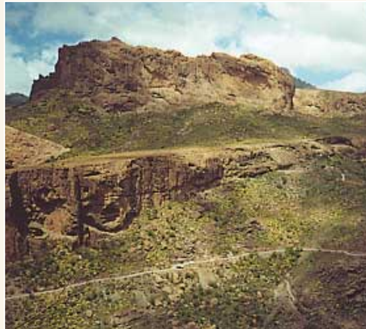
Gonzalo - Lomo de La Cañada de La Perra

Durante el recorrido tenemos unas magníficas vistas del barranco con mayor longitud de la Isla: en este tramo, el Barranco de Soria; al norte y en su tramo alto, el Barranco de las Adjuntas y Ayacata; y en su tramo bajo, y hacia el sur, el Barranco de Arguineguín. Los numerosos roques, pequeñas rampas y los solapones que se han originado en los riscos nos