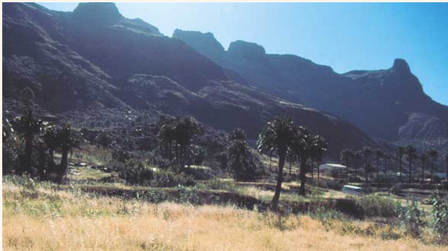
Llano de Fataga - Roque Almeida - Amurga

En general, esta ruta resulta muy llamativa debido a la variedad, tanto florística como geomorfológica y paisajística que durante el recorrido podemos disfrutar, salvo al final, ya que nos encontramos con los depósitos de numerosas basuras que algunas personas acumularon antaño en el Lomo La Ventana sin consideración. La presencia etnográfica es importante, aunque no numerosa, debido a la localización de una era casi al finalizar nuestro recorrido, estructura ésta que se encuentra en perfecto estado, realizada por los antiguos canarios para desgranar las mieses y aventar los cereales.