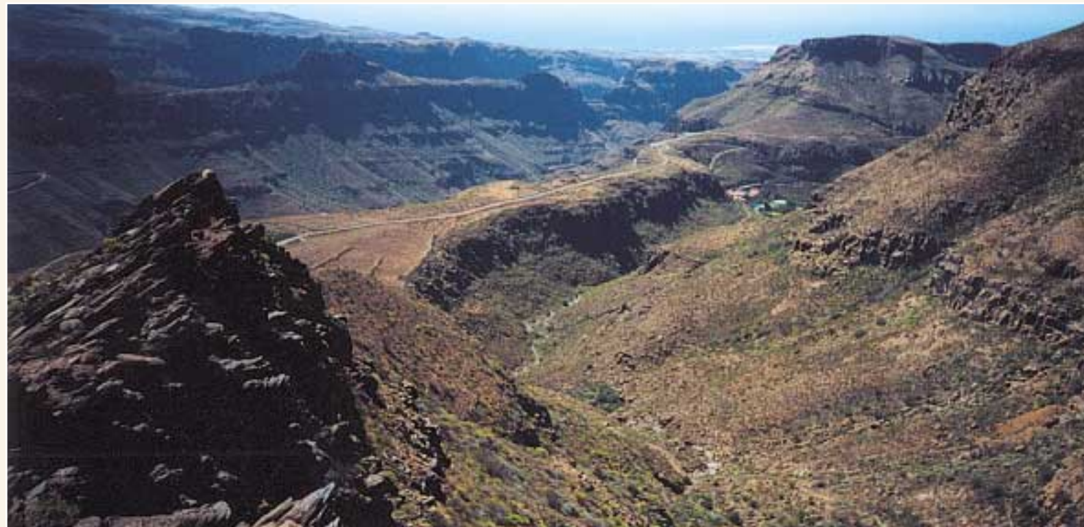
Lomo de Los Palmitos - Barranco de Ayagaures