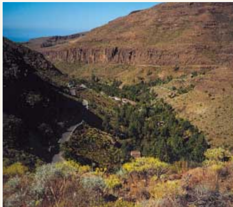
Los Palmitos Park

El pinar ( pinus canariensis ) también hace notable su presencia durante casi todo el recorrido, acompañado a su vez por numerosas jaras ( cistus monspeliensis ) y jarones ( cistus symphytifolius ).