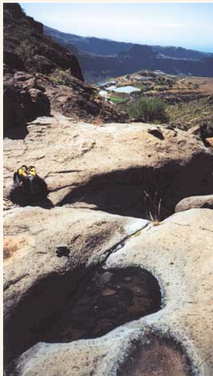
Barranco de Las Charquillas