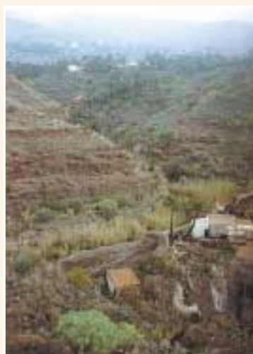
Molino de Cho' Cabello

Esta ruta se inicia desde el pueblo de Santa Lucía, en el municipio que lleva su mismo nombre. Entrando en el pueblo, ya sea por la GC-65 o por la GC-552 procedentes del sureste de la Isla, nos encontramos a la derecha el Museo "El Hao", construido con piedra. Comenzamos el camino justo frente al mencionado museo, en la boca de la calle asfaltada que lleva por nombre "Juan de Rioayala" y donde se encuentra una tienda