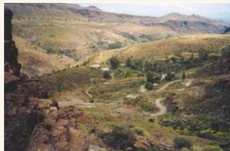
Los Sitios de Arriba