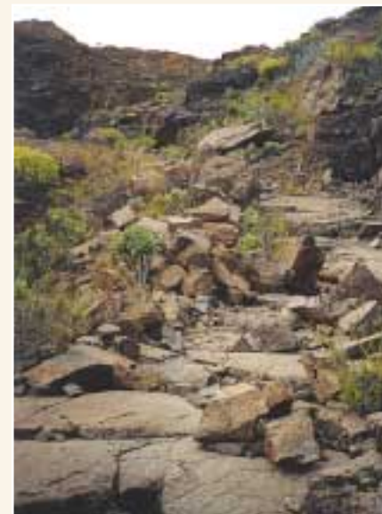
Camino a Degollada de Los Molinos

La variedad florística en esta ruta es considerable, pudiendo observar escobones ( chamaecytisus proliferus ), comicales ( periploca laevigata ), vinagreras ( rumex lunaria ), lavanda ( lavandula minutotii ), salvia ( salvia canariensis ), jaras ( cistus monspeliensis ), etc. Ya desde la Degollada de "Los Molinos" tendremos una ligera bajada al pueblo de Fataga y una bonita vista del barranco, así como de los espectaculares andenes que lo conforman.